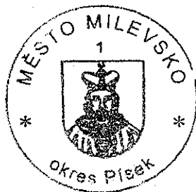
Bc. Zdeněk Herout starosta města

A handwritten signature in black ink, appearing to read 'Zdeněk Herout'.